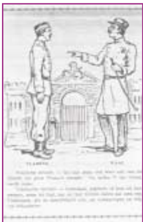
Spotprent