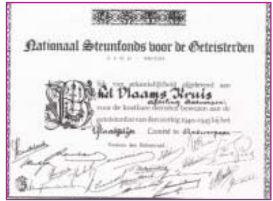
Afdruk van een "diploma van erkentelijkheid", overhandigd voor bewezen dienst aan het N.S.V.G.

Tijdens die Duitse bezetting zouden enkele Vlaams-Nationale organisaties o.a. het VNV en De Vlag, pogingen ondernemen om een aantal Vlaams-gezinde verenigingen uit de welzijnssector te verenigen in de grote organisatie "Volkswelzijn". Dit waren o.a. de Vrouwelijke Sociale Dienst, het Vlaams Verpleegstersverbond, Het Vlaams Vroedvrouwenverbond, Vlaamse Kinderzegen en uiteraard ook Het Vlaamse Kruis. Maar enkele dagen na de oprichting stapte Het Vlaamse Kruis al uit de organisatie. Het Vlaamse Kruis wou immers de sociale hulpverlening in Vlaanderen volledig in eigen handen houden. Met De Vlag en andere collaborerende verenigingen, heeft het bestuur van Het Vlaamse Kruis tijdens de oorlogsjaren nooit nauwe banden gehad. Het verleende nauwelijks medewerking aan de Duitse bezetter of aan de Duitse oorlogsvoering, met uitzondering tijdens de luchtbombardementen en natuurrampen, waar de beschikbare leden dadelijk in de bres sprongen om hun getroffen volksgenoten onderdak te verlenen