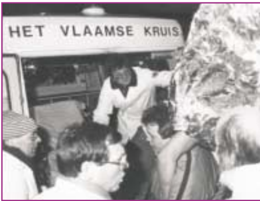
Afdeling Brugge beet de spits af voor de hulpverlening bij de gekapseisde Herald of Free Enterprise