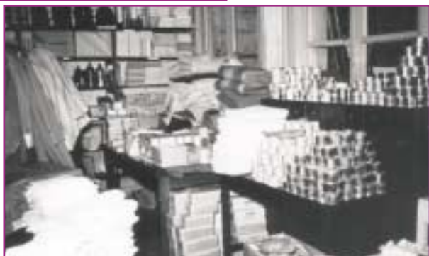
Bedelingslokaal Oudaan, waterramp Antwerpen

We kunnen ons gerust voorstellen dat voorlopig alles geconcentreerd werd op het Algemeen Secretariaat en praktisch al het werk diende verricht te worden door één enkel persoon. De algemeen secretaris bekloeg zich dan ook bij het bestuur en drong meermaals aan om hem hierbij meer en meer te ontlasten. Men zou overgaan tot de oprichting van de afdeling Antwerpen en trachten een groot gedeelte van het werk door deze afdeling te laten overnemen.