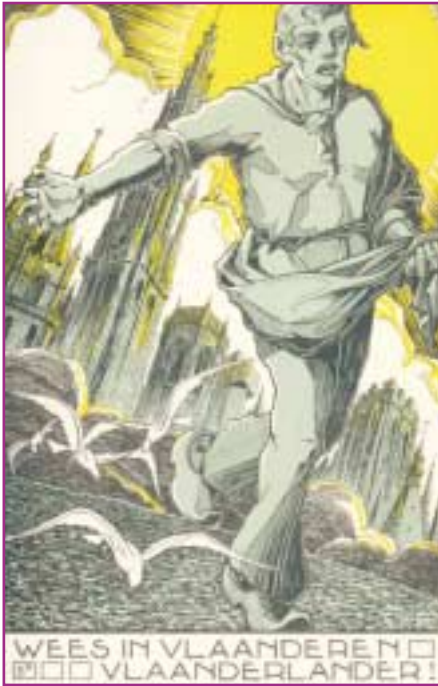
pentekening dhr. Jos Speybrouck