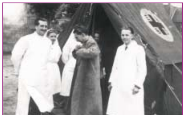
Wie nog over voldoende manschappen kan beschikken hervatte de activiteiten.