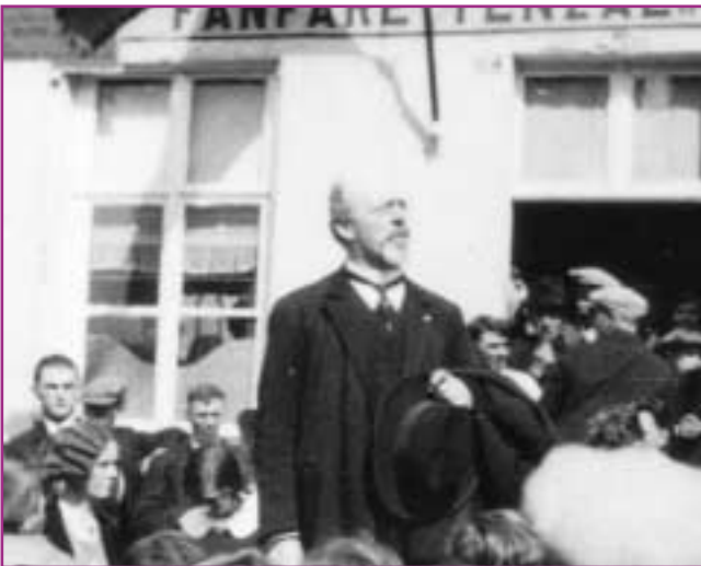
August Borms houdt toespraak voor lokaal Vlaamse fanfare "Tenzal"