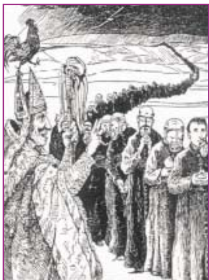
Spotprent op Kardinaal Mercier, met het onderschrift "Moi je suis d'un race destinée à dominer et vous êtes d'une race destinée à servir". Woorden van Zijne Excellentie Kardinaal Mercier aan een zijner Vlaamse priesters. Nooit was de verdrukking der Vlaamsgezinde priester zo geweldig als onder de dwingelandij van deze Waalse politiker.

Tallose afdelingen hadden het erg moeilijk. De werking werd stopgezet in Kapellen, Hemiksem en Neder-over-Heembeek. Ook in Niel lag alles stil wegens een sabotage van het gemeentebestuur. In Mechelen was het niet veel